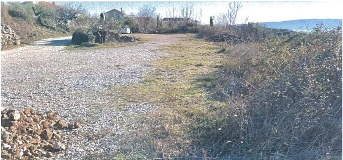
zemljište i pristupna cesta